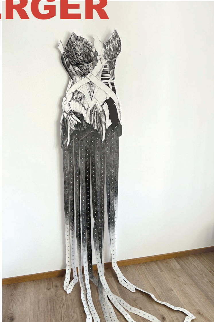
„queen of time“ (Ausschnitt). Cut Out: Installation. Nero auf Papier, Schrauben, Muttern. ca 240x45cm. 2025