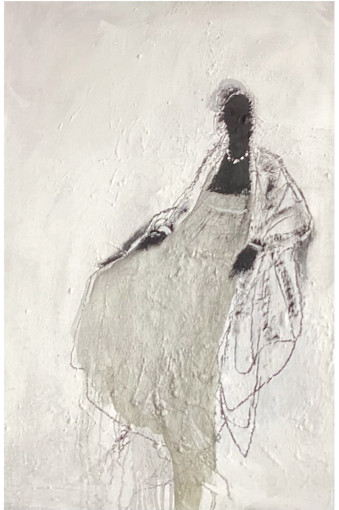
Angelo Bordiga, 2023, Mischtechnik auf Leinwand, 100 cm x 70 cm. Foto: Bordiga.

Angelo Bordigas Portraits suchen eine ästhetische Wahrheit fern von Künstlichkeit und kommerziellen Einflüssen. Seine Figuren verhar- ren in stiller Spannung - stehend, zusammengerollt oder in die Ferne blickend, oft dem Betrachtenden abgewandt und wie Teil eines leisen Dramas.