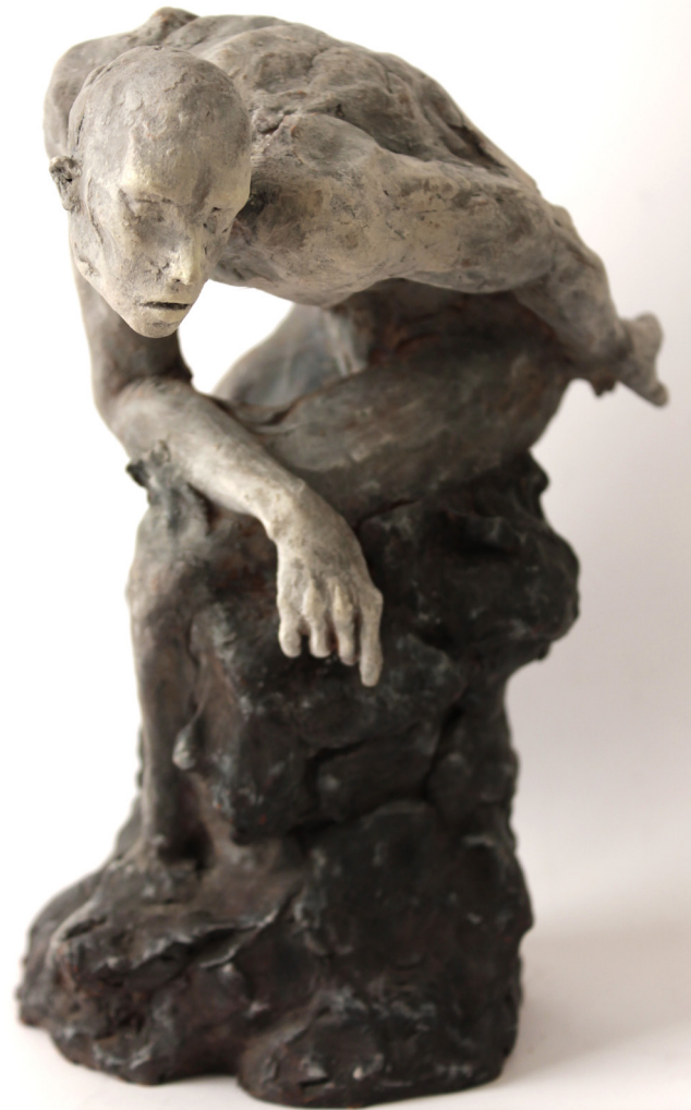
„Uomo in cambiamento“, 2020, terracotta patinata, 26 x 22 x 15 cm.

The sculpture is inspired by Plato's Allegory of the Cave; the man is captured at the exact moment in which he decides to change direction and move beyond his own point of view. The twist of the body creates a duality in the work's expressive language, conveying a sense of both closure and openness. The latter emerges from the extension of the left arm, which points behind him, indicating the discovery of a new reality.