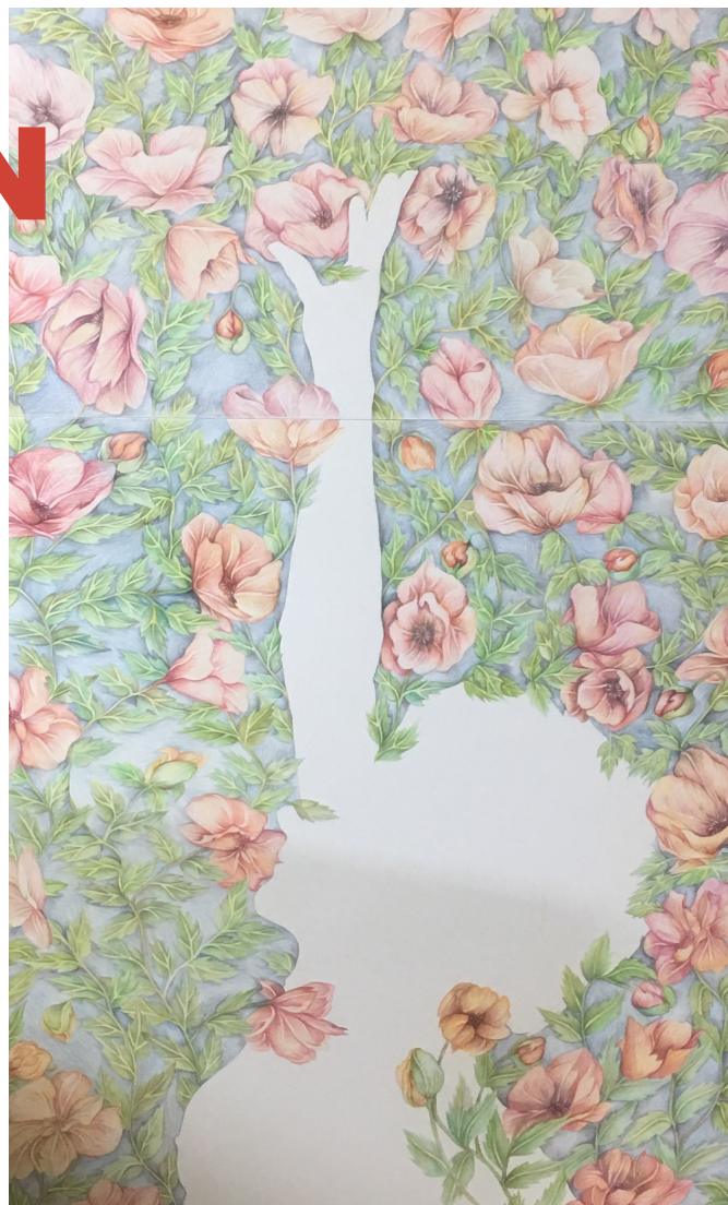
„moonlight“, 2026, Buntstift auf Offsetkarton, ca 105 x 160 cm, gerahmt, signiert.